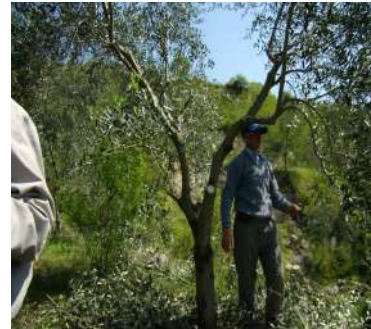
Foto të momenteve të ngritjes së provave në të tre fermerat